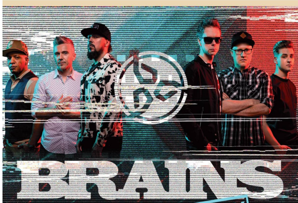
BRAINS - október 2. 18.00 óra