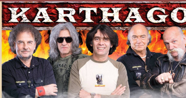
KARTHAGO - október 1. 21.00 óra