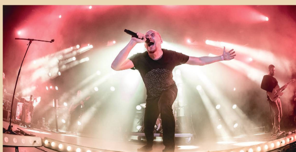
VAD FRUTTIK - október 3. 20.30 óra

Az eseményen kép/hangfelvétel készül, amit a rendezvény résztvevői megjelenésükkel tudomásul vesznek.