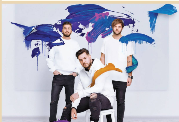
FOLLOW THE FLOW - október 2. 21.00 óra