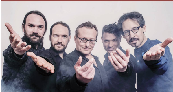
MISZTRÁL - október 1. 18.00 óra